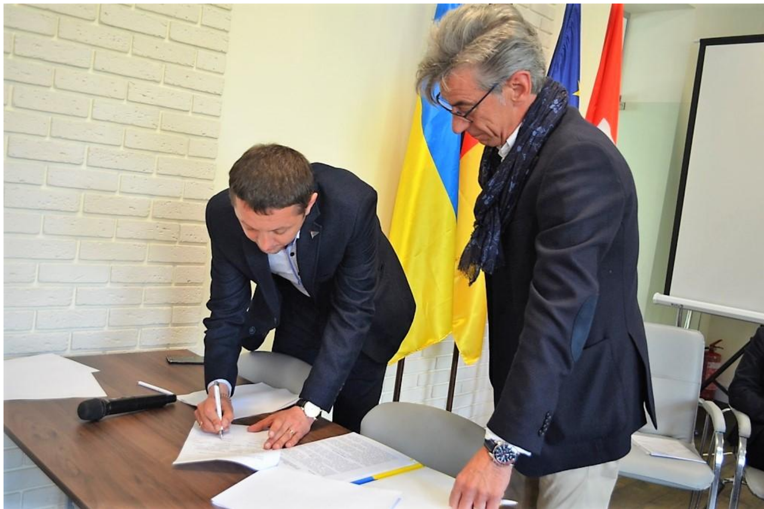
Угода про співпрацю ТОВ “Ферпласт-Україна” та Центр професійно-технічної освіти міста Житомира